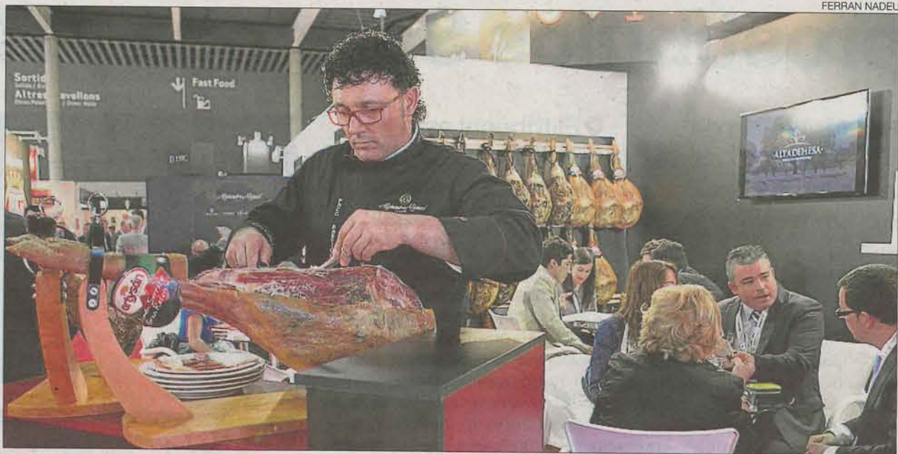
►► Un cortador profesional de jamones en la feria Alimentaria, ayer.